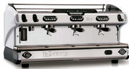
TRADITIONNELLE S9 TROIS GROUPES