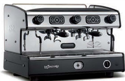
TRADITIONNELLE S2 DEUX GROUPES