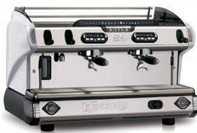
TRADITIONNELLE S9 DEUX GROUPES