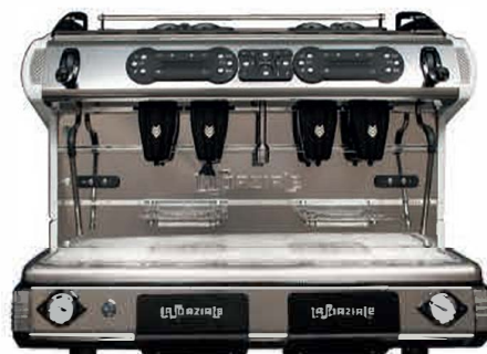
BE POD QUATRE GROUPES