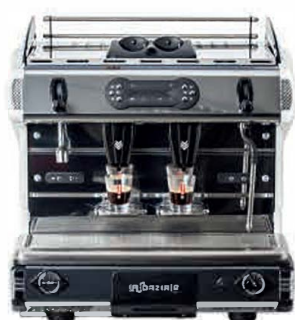
BE POD DEUX GROUPES