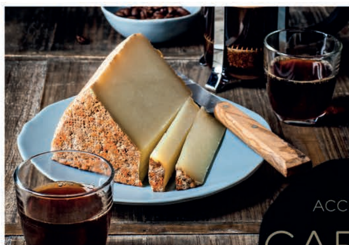
OSSAU-IRATY & BURUNDI KIRIMIRO