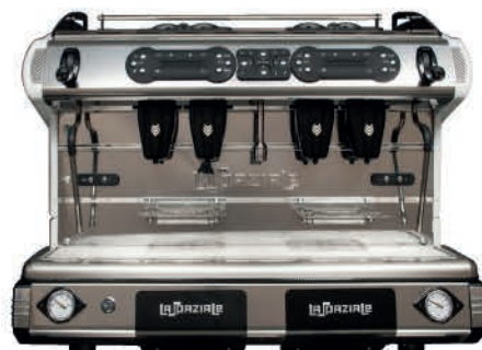
BE POD QUATRE GROUPEES