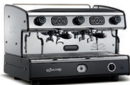
TRADITIONNELLE S2 DEUX GROUPES