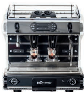
BE POD DEUX GROUPEES