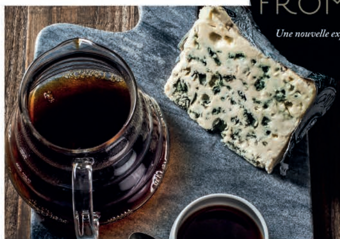
ROQUEFORT & BRÉSIL SUL DE MINAS