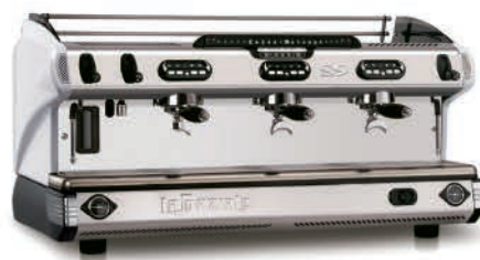
TRADITIONNELLE S9 TROIS GROUPES