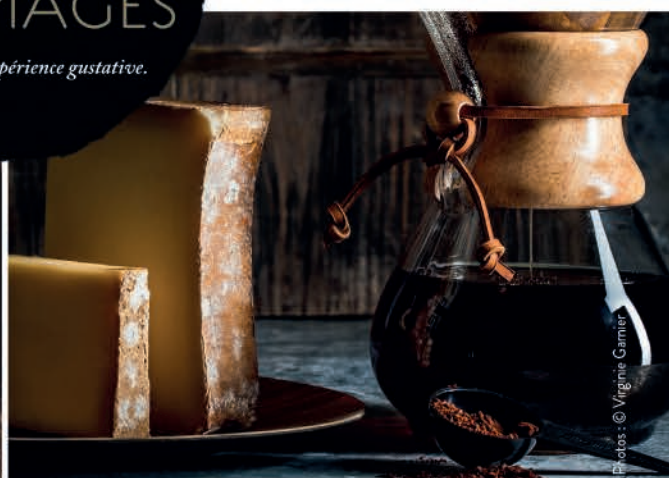
BEAUFORT & HONDURAS

ACCORDS CAFÉS & FROMAGES Une nouvelle expérience gustative.