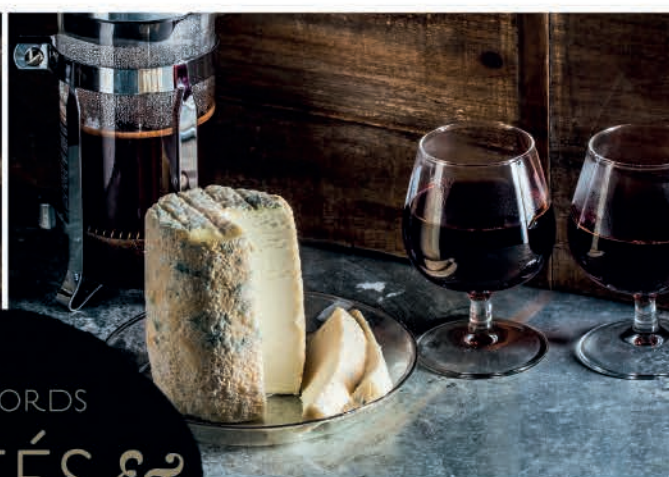
CHAROLAIS & BLUE MOUNTAIN