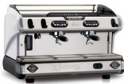
TRADITIONNELLE S9 DEUX GROUPES